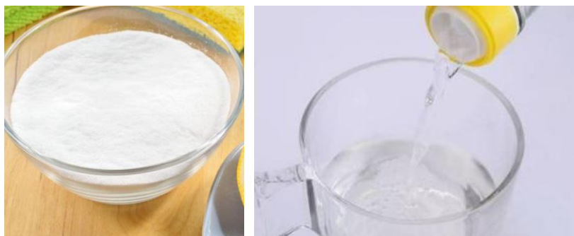
baking soda / witte azijn + water

**Als u een reinigingsmiddel gebruikt, zorg er dan voor dat u het eerst op de zachte doek spuit en NIET op de kraan zelf.